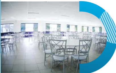
Salão de Festas - 2º piso