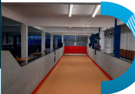
Cancha de bocha