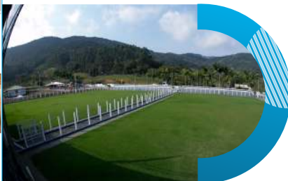
Campos de Futebol Suíço