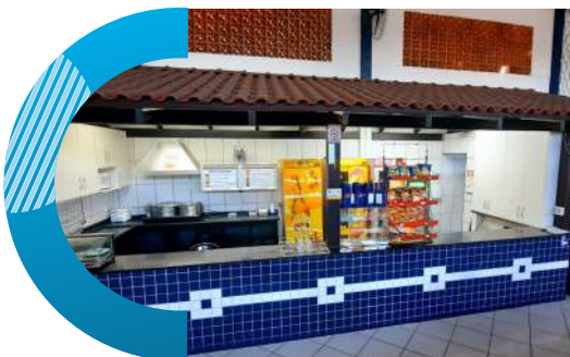
Bar e Lanchonete