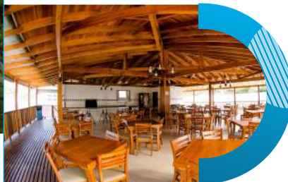
Quiosque da lagoa