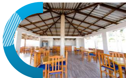
Quiosque do Parque