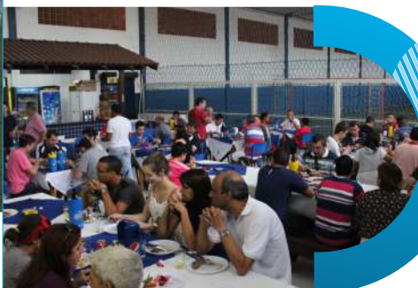
Espaço de alimentação