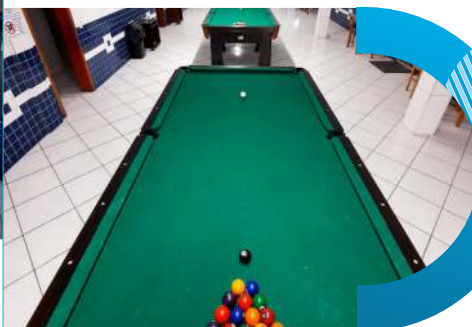
Mesas de sinuca