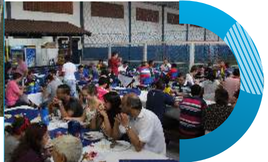
Espaço de alimentação