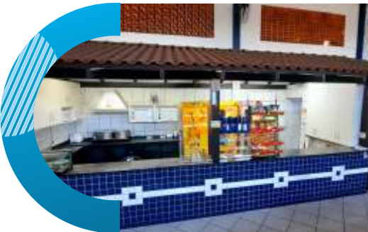
Bar e Lanchonete