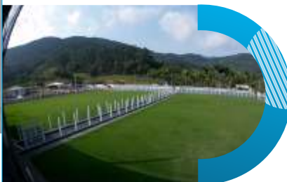
Campos de Futebol Suíço