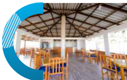
Quiosque do Parque