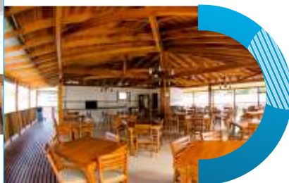
Quiosque da lagoa