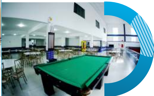
Salão de Bocha