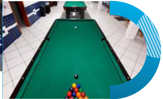
Mesas de sinuca