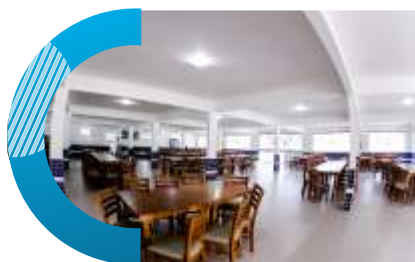
Salão de Festas - térreo