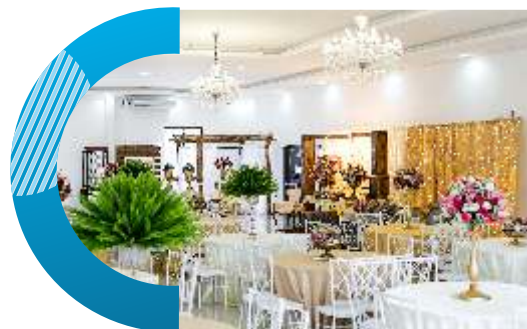
Salão Piso Superior