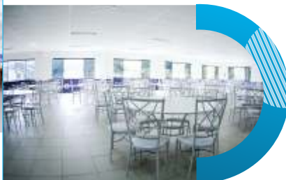
Salão de Festas - 2º piso